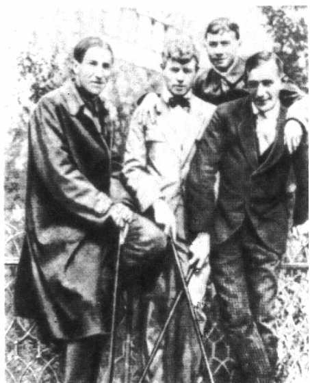
Анатолий Мариенгоф, Сергей Есенин, Александр Кусиков, Вадим Шершеневич. 1919 год

Есенин вкладывает все свои силы в обоснование своих прав и своих претензий. Он отстаивает их постоянно, и когда наступает момент отвержения этих претензий, то происходит взрыв, выраженный в порыве гнева или даже ярости. Мало того, Есенин чувствует себя не только разгневанным, но и правым. Вспомнив прошлые расшаркивания перед сильными мира сего, он пытается стать независимым, певцом новой, крестьянской Руси. Но его мечты на "обновленную" Россию оказались утопией. Реальная литературная жизнь оказалась более сложной, чем до революции. Полная монополия большевиков на печать, привела к тому, что в большевистских изданиях засели люди, не понимающие таланта и идей молодого поэта. Критику своих стихов в большевистских статьях Сергей воспринимал как ущемление своих претензий и своего самолюбия.